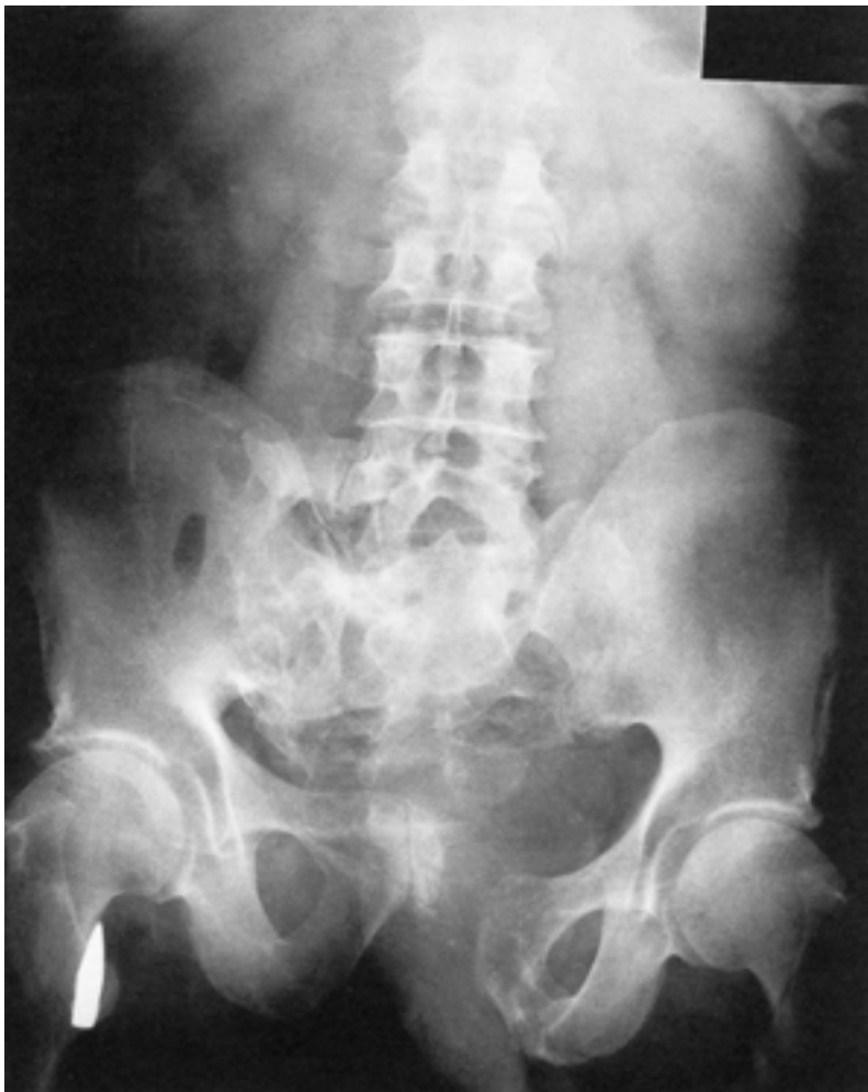
Ryc. 8.2. Zdjęcie AP w pozycji leżącej byłego żołnierza, który został postrzelony w czasie operacji w Normandii w 1944 roku. Lewa część obręczy biodrowej oraz prawe skrzydło kości krzyżowej zostały rozerwane przez pocisk, który następnie zmienił kierunek i utkwził w okolicy prawej kości biodrowej, w pachwinie. Objawy przebytych dawniej urazów mogą czasami być widoczne na zdjęciach i powodować mylące zmiany kostne.